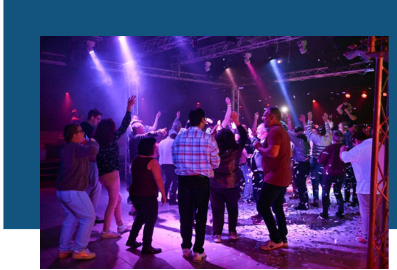
"On s'ambiance, il y a de la bonne musique"

Dans le cadre des Semaines de l'inclusion organisées par la Ville jusqu'au samedi 26 avril (avec divers partenaires), ce mercredi 23 avril, handicapés et valides se sont retrouvés en discothèque, au Privilège, rue de Charleville, à Nevers.